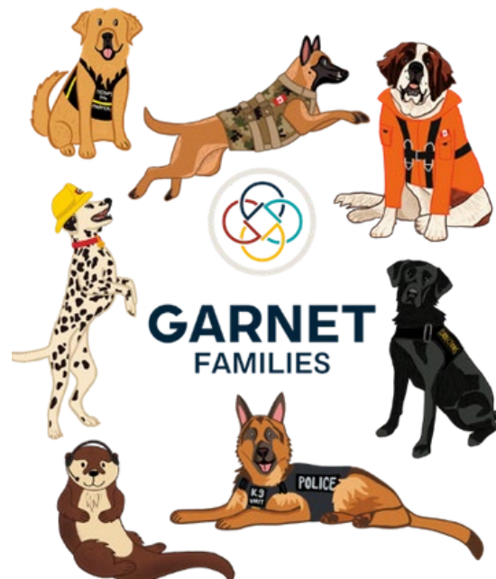
Figure 2: Chaque animal représente une famille différente dans le secteur de la défense et/ou de la sécurité publique. Par exemple, la loutre, choisie par des consultations communautaires, symbolise les familles du secteur des communications d'urgence.

Beaucoup des mêmes enjeux auxquels les Garnet Families font face continuent d'émerger au fil des années, parallèlement à de nouvelles nuances qui font surface lors de discussions. La persistance continue de ces enjeux souligne le besoin urgent d'attention et d'action. Pour continuer à faire avancer le discours et l'action de façon à avoir une incidence positive sur les familles, Garnet Families nécessitera un investissement et un soutien de tous les secteurs de la société dont les individus, les familles, les communautés, les organismes et divers paliers du gouvernement. Alors que nous nous tournons vers l'avenir, les discussions de la table ronde insistent sur le fait qu'il est crucial de travailler en collaboration pour continuer à faire entendre les voix des Garnet Families et faire passer le message d'un besoin de changement. Ensemble nous pouvons bâtir un futur plus solidaire pour les Garnet Families .